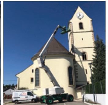
Changement d'une partie de descente de gouttière.