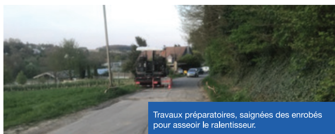
Travaux préparatoires, saignées des enrobés pour asseoir le ralentisseur.