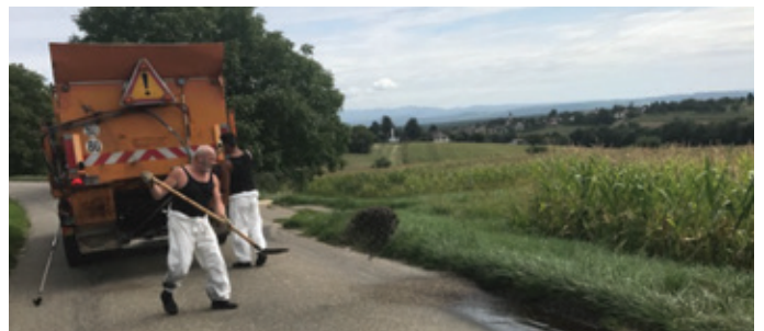
Travail réalisé au mois d'août, route de Bruebach.

La route de Bruebach nous a occupés toute une journée... non seulement en raison de l'ampleur de la tâche à réaliser, mais aussi en raison de l'incivilité de certains conducteurs ou conductrices. Pour un conducteur, les barrières garnies de panneaux d'interdiction de circuler n'étaient pas assez lourdes... Une autre conductrice s'était perdue avec son GPS entre son domicile (Rosenau) et Mulhouse... Il a souvent fallu déplacer le camion !