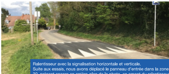
Ralentisseur avec la signalisation horizontale et verticale. Suite aux essais, nous avons déplacé le panneau d'entrée dans la zone 30, présent encore en arrière-plan de la photo, en amont du ralentisseur.

Le cabinet d'ingénierie Cocyclique de Soultz nous a secondés dans les calculs des pentes à respecter pour la réalisation de cet ouvrage.