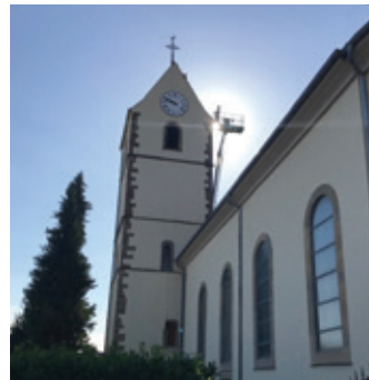
Remise en place de tuiles sur le clocher et nettoyage des gouttières.

Enfin, la barre horizontale de la croix du vaisseau, qui menaçait de chuter, a été solidement vissée !