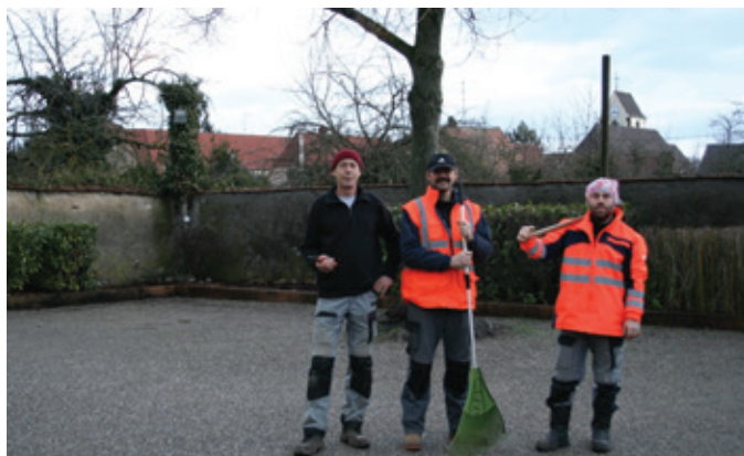
Le terrain de boules en parfait état, suite au travail de notre équipe technique.

Nos agents techniques ont remplacé les bastinges. Les anciennes poutres avaient subi les outrages du temps : le bois avait pourri. Le terrain est à présent bien limité par de belles solives achetées dans une scierie locale. De longues tiges métalliques les fixent au sol. Les haies et l'arbre ont aussi été retaillés.