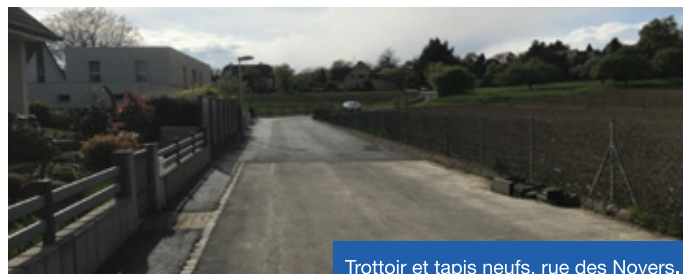
Trottoir et tapis neufs, rue des Noyers.

Il manquait encore une petite portion d'enrobés dans la Rue des Noyers... Elle a été réalisée en avril 2017.