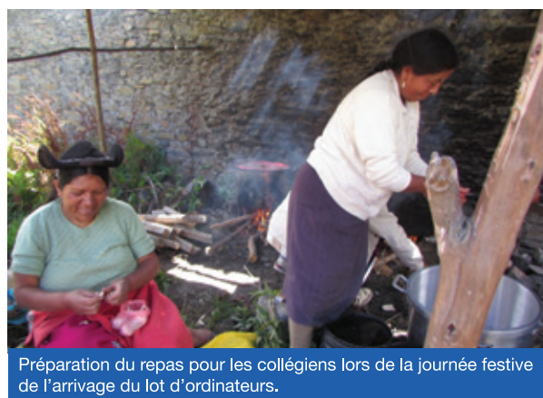
Préparation du repas pour les collégiens lors de la journée festive de l'arrivée du lot d'ordinateurs.