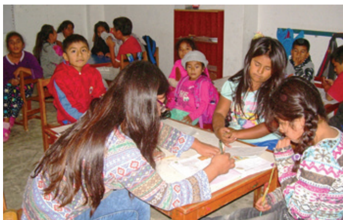
Cours de soutien scolaire à la médiathèque.

Durant les vacances scolaires (de janvier à début mars), nous organisons une action intitulée « Les vacances utiles » pour 130 enfants, avec la prise en charge financière de 12 professeurs et d'une animatrice.