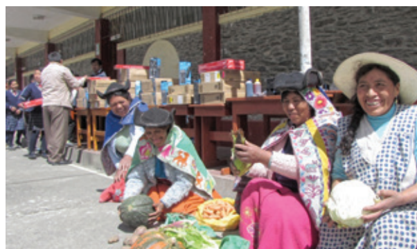
À l'arrière-plan, les ordinateurs livrés au collège de Cuyocuyo. Les femmes nous remercient en nous offrant des produits de la Pachamama, la déesse de la Terre mère, vénérée dans les Andes.

Site Internet : http://agirpourleperou.free.fr